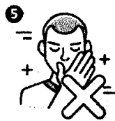
Evita tocar tu rostro