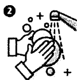
Lavado frecuente de manos