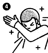
Al estornudar o toser