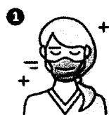
Uso de mascarilla